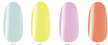
67 Babakék 68 Kanárisárga 69 Világos mályva 70 Érett mangó

Négy fantasztikus, finoman felvillanó árnyalat, mellyel „kiszínezheted” vendéged szürke hétköznapjait.