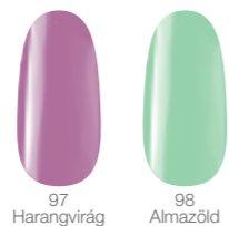
97 Harangvirág 98 Almazöld