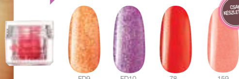
FD9 FD10 78 159