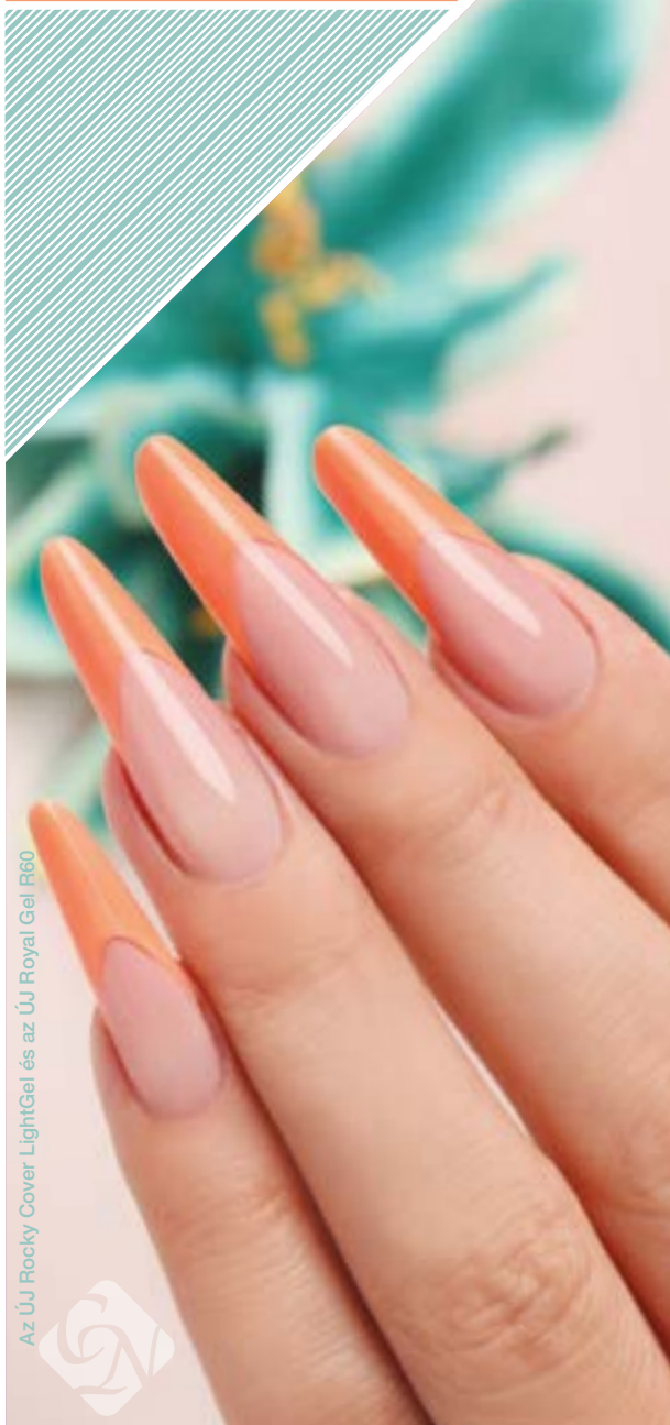
Az ÚJ Rocky Cover LightGel és az ÚJ Royal Gel R60