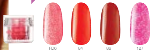
FD6 84 86 127