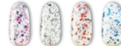
Konfetti pink Konfetti lila Konfetti piros Konfetti kék

Bolondos-bulis konfetti hatás, vidám-bohém vendégeknek.