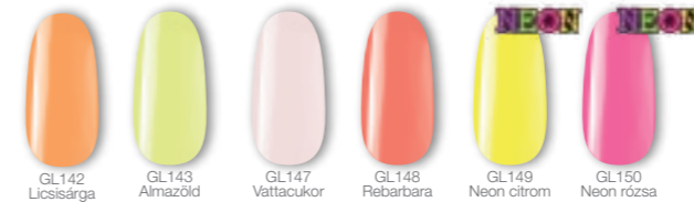
GL142 Licsisárga GL143 Almazöld GL147 Vattacukor GL148 Rebarbara GL149 Neon citrom GL150 Neon rózsza

Hat új, káprázatos klasszikus CrystaLac szín – 4 visszafogottabb és 2 lélegzetelállító-neon árnyalat.